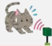
猫よけ器 (超音波発生装置)

これらの他にも方法があります。猫との根比べでもありますので、いろいろ試してみてください。侵入防止策は継続することが重要です。