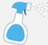
匂いで防ぐ (竹酢、コーヒークラス等)

自宅の敷地内は、自信で猫が入ってこないよう対策をとることが原則です。敷地内に猫が入ってくると困る方は、次のような侵入防止策をとってみましょう。