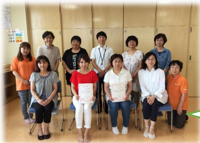
おたすけ講習修了者と先輩おたすけさん