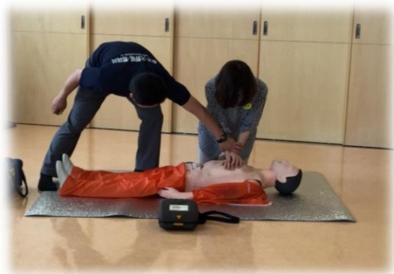
救急救命もしっかり勉強しました