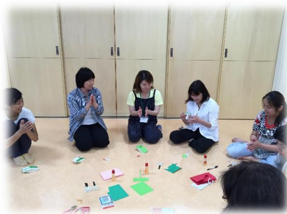
簡単に作れるおもちゃ作り 保育士さんに指導して頂きました。