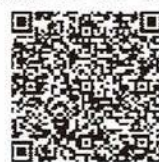
▲妊婦健診助成金請求の手順