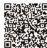
▲多胎妊婦健診の健診費用補助