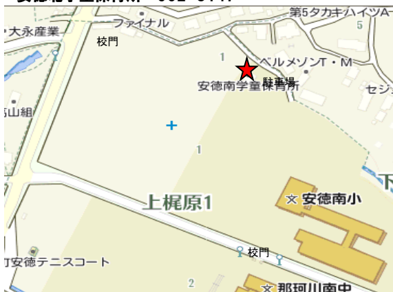
安徳南学童保育所 953-6221