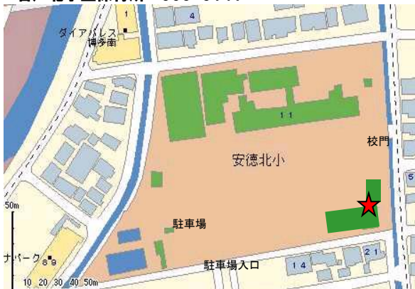
安徳北学童保育所 952-8147