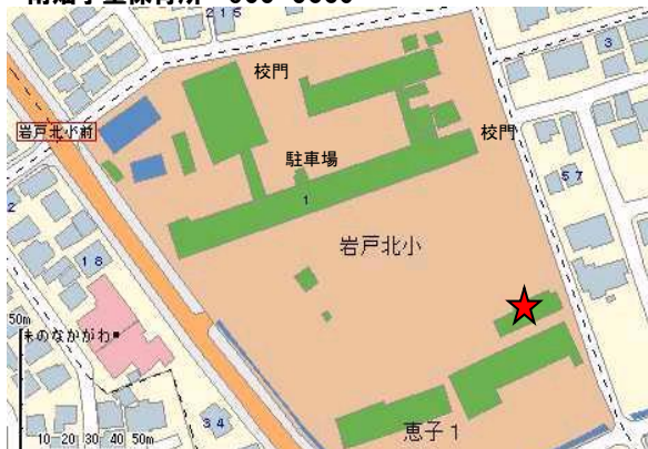
岩戸北学童保育所 953-3141