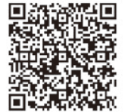
▲多胎妊婦健診の 健診費用補助