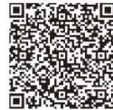
▲妊婦健診助成金 請求の手順