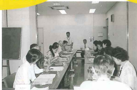
実行委員会の風景