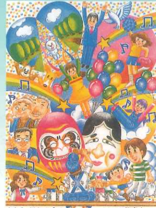
男女共同参画 那珂川町