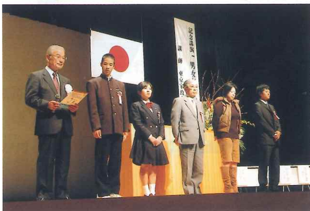
町長と町民代表による都市宣言