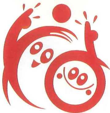
最優秀賞 駒井 瞭 (東大阪市)