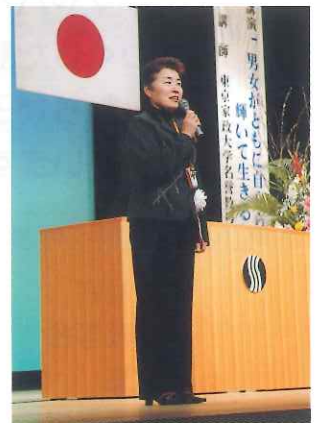
実行委員長あいさつ