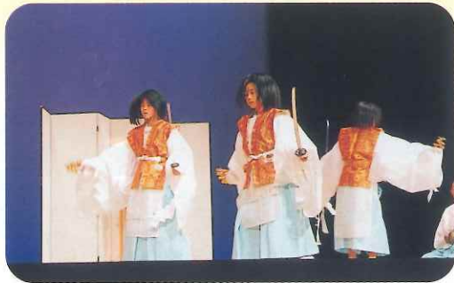
子どもによる岩戸神楽