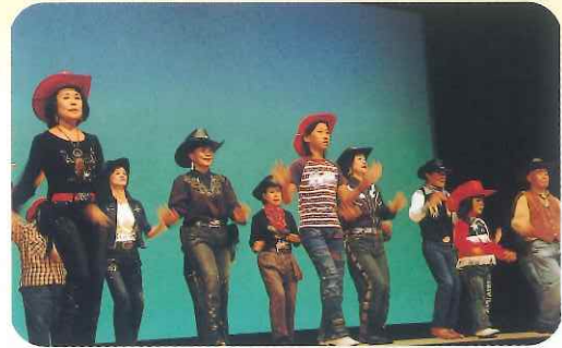
カントリーダンス