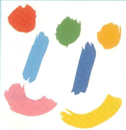
最優秀賞 堀江 豊 (広島県 廿日市)