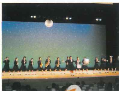
人権フェスタながわステージ発表