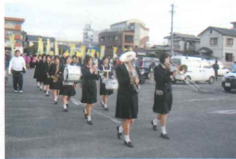
福岡女子商業高等学校吹奏楽部を先頭に出発