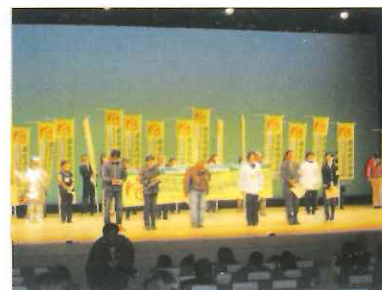
男女共同参画都市宣言アピール