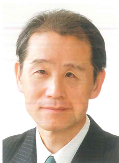
社会医療法人喜悦会 理事長