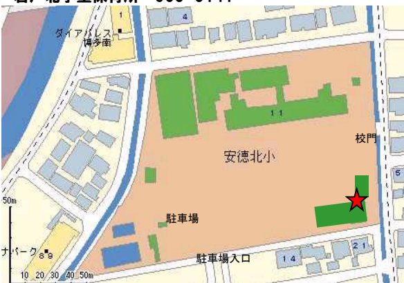
安徳北学童保育所 952-8147