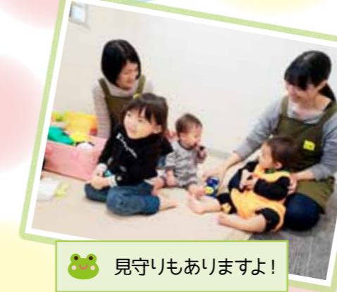
🐸 見守りもありますよ!