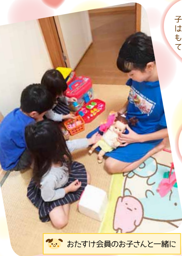
🐼 おたすけ会員のお子さんと一緒に

子どもさんを預かる時は、私がたくさん遊んでもらってパワーをもらっています。 T.R