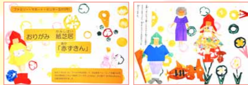
🐰 11月に行われた市民文化祭に出展しました。