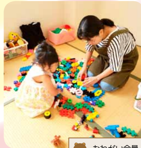
🐻 おねがい会員一斉登録会時の見守り