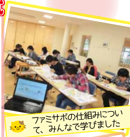
🐱 ファミサポの仕組みについて、みんなで学びました